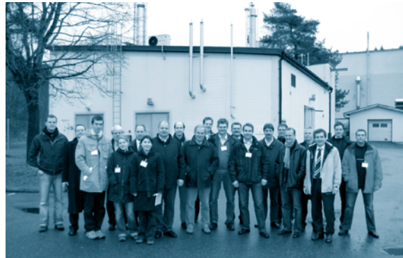
Exkursionsteilnehmer vor der Biogas-aufbereitungsanlage in Borås

Neue Forschungsergebnisse zeigen, dass mit Einsatz einer Aminwäsche das im Biogas enthaltene CO 2 fast komplett entfernt werden kann (Methangehalt ca. 99,5 %). Ein großer Vorteil der Aminwäsche ist der geringe Methanschlupf von ca. 0,5 %.