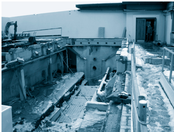
Abbrucharbeiten im Winter