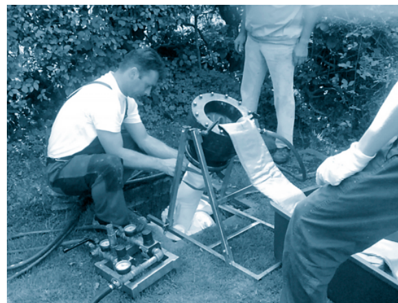
Inlinersanierung im Anschlusskanal

Etwa 75% der Maßnahme wurden bisher umgesetzt, und schon jetzt zeigt sich eine klare Verbesserung der hydraulischen Probleme an der Schmutzwasserpumpstation.